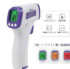
手持ち型 非接触体温計

キャリア・ソフィアでは、感染症拡大防止策の一環として、セミナー時に下記感染予防グッズをとりいれています。