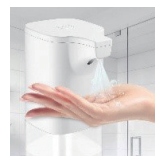
非接触 手指消毒器