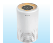
小型空気清浄機 など