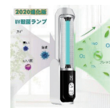
UVライト 共有物の消毒に使用